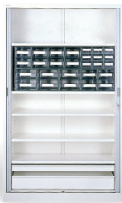
Armario para dispositivos médicos