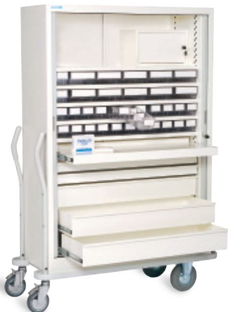
Armario móvil de traslado

PraticDose® pone a su disposición su soporte técnico con el fin de ayudarle a definir su acondicionamiento ideal, gracias a simulaciones informatizadas.