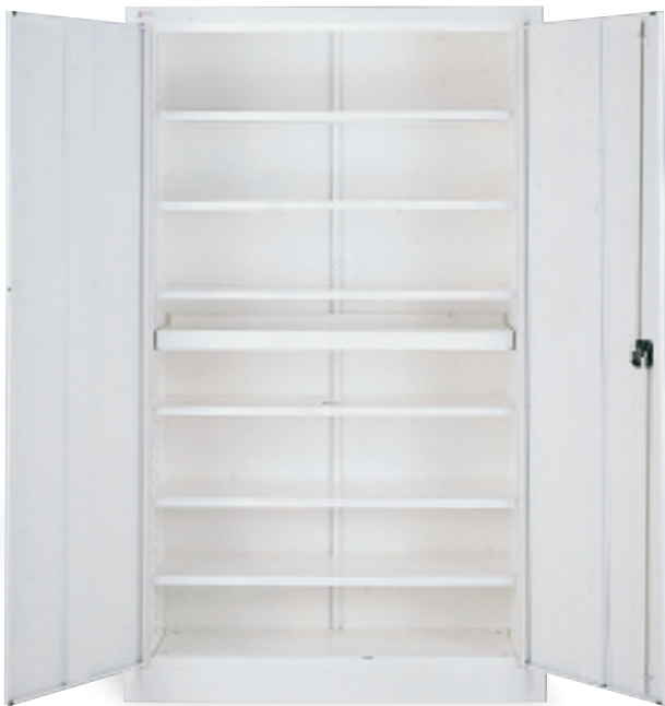
Armario con puertas batientes