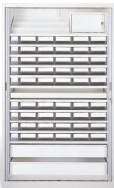
Armario para larga estancia para una gestión nominativa de los 45 residentes