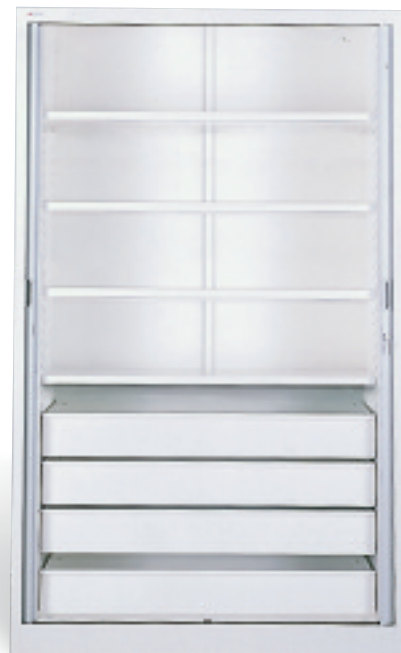
Armario de solutos