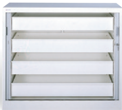
Armario modelo pequeño

*disponible con cerradura mediante dos puertas batientes (Ref. 76121)